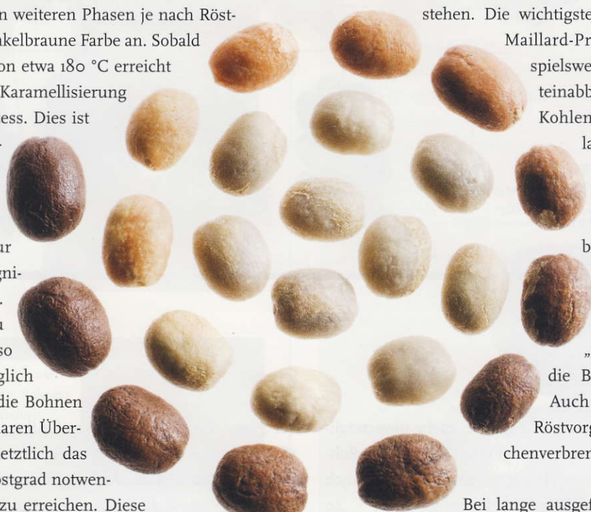
Die Entwicklung der Bohne beim Röstvorgang. Sie verändert Ihre Farbe und die Oberfläche. Diese ändert sich von Anfangs glatt, über rau zurück zu glatt.

werden allerdings nicht nur Säuren abgebaut, sondern es entstehen auch neue Säuren. Daneben spielt die Kaffeesorte eine wichtige Rolle, so enthalten Hochlandkaffees aus Afrika mehr Säure als indischer Robusta. Neben der Kaffeeart, der Varietät und der Höhenlage ist das Terroir – also die Bodenbeschaffenheit – wie auch beim Wein von entscheidender Bedeutung. So trägt ein stark eisenhaltiger Boden – insbesondere bei Coffea arabica – ebenfalls zu einer Säurebildung bei. Silberhaltige Böden hingegen fördern Gewürz- oder Nussaromen im Kaffee. Die Kunst des Röstens liegt darin, ein ausgewogenes Verhältnis zwischen Geschmack (zum Beispiel Säure, Bitterkeit und Süße), „Mundgefühl“ (Körper) und Aroma (Geruchsstoffe) im Kaffee zu erzeugen.