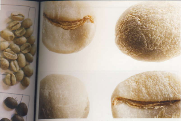
Farbwechsel: Vom Hellen ins Dunkle.