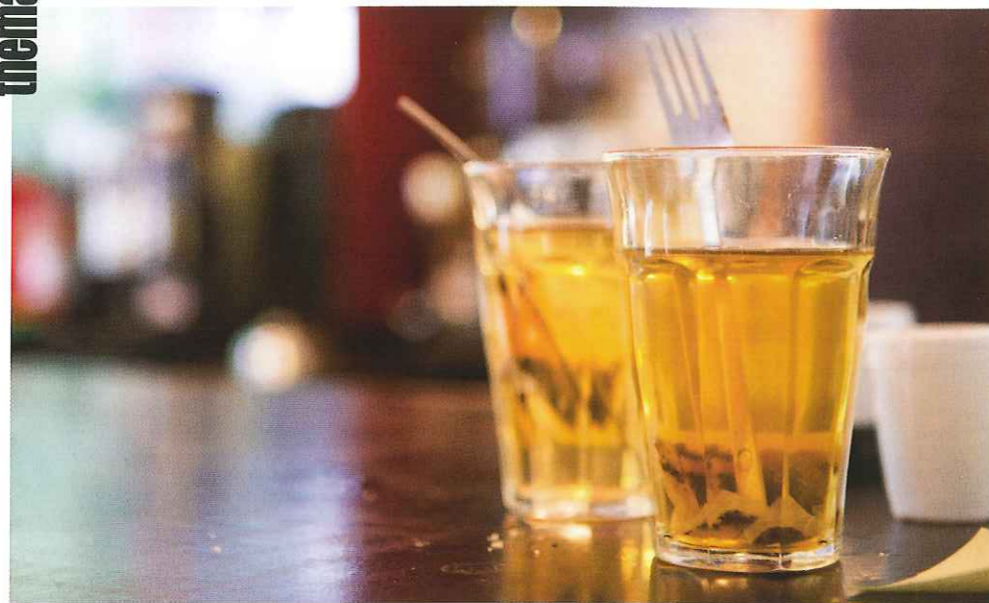
Auch wer im „Caffènation“ Tee ordert, bekommt sein Wunschgetränk - in unkonventionellem Arrangement