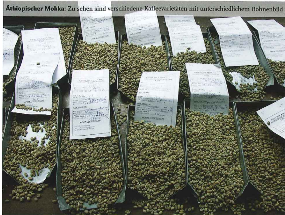
Äthiopischer Mokka: Zu sehen sind verschiedene Kaffeevarietäten mit unterschiedlichem Bohnenbild