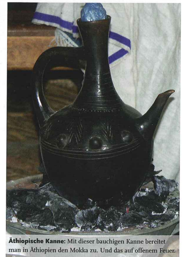
Äthiopische Kanne: Mit dieser bauchigen Kanne bereitet man in Äthiopien den Mokka zu. Und das auf offenem Feuer.

In Äthiopien wird Mokka immer im Rahmen der äthiopischen Kaffezeremonie gereicht. Dabei wird der Kaffee zunächst auf einer Metallpfanne über glühenden Kohlen frisch geröstet, in einem Holzmörser zerstoßen und später in einer Tonkanne (Jebanna) gesiedet. Zum Kaffee wird traditionell Popcorn oder gerös-