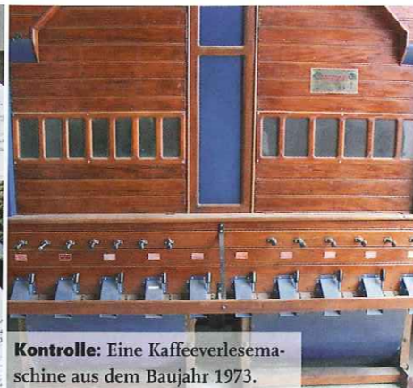
Kontrolle: Eine Kaffeeverlesemaschine aus dem Baujahr 1973.

Grund also, bei einsetzender Undichtigkeit, die ganze Mokkakanne zu entsorgen.